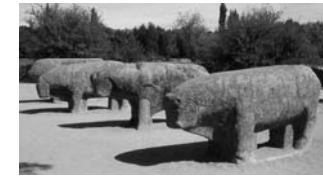
11. Toros de Guisando

Volviendo a la N-403, giramos a la derecha y llegamos a San Martín de Valdeiglesias, ya en la Comunidad de Madrid, cuya oficina de turismo está en la céntrica Plaza Real, donde nos indicarán como llegar al Castillo de la Coracera, iniciado en la época de la repoblación de Alfonso VIII, y finalizado en el s.XV, que sirvió de residencia a Isabel de Castilla tras ser proclamada heredera de la Corona de Castilla. El castillo está en buen estado de conservación y es posible visitarlo ( Ayuntamiento: 918611308) También podemos visitar la iglesia de San Martín de Tours y la ruta de las ermitas.