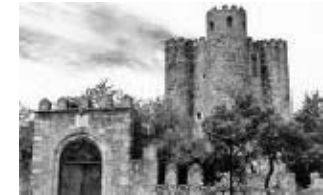
15. Castillo de la Coracera siglo XV