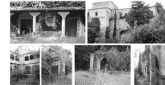
12. Monasterio de los Jerónimos siglo XV