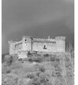
Castillo de Mombeltrán