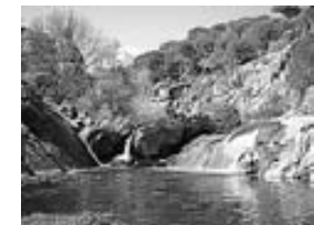
29. Zona de Pinares. Río Bécidas ( El Hoyo de Pinares)