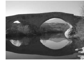
22. Puente románico de Valsordo