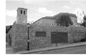
26. Museo Adolfo Suarez y la Transición. Iglesia vieja ( Cebreros)