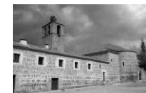
Abadía Nuestra Señora de la Asunción. ( Burgohondo)