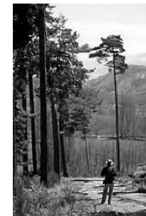
Pinar de Hoyocasero