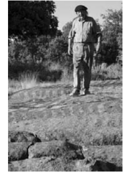
Bosque de Agustín Ibarrola ( Muñogalindo)