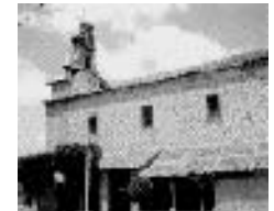
Iglesia Nta Sra de la Asunción sXVIII ( Padiernos)