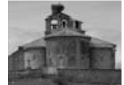
Iglesia sXII-XIII románico-mudejar ( Narros del Puerto)