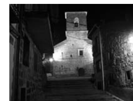
Iglesia San Antonio de Padua. ( Piedralaves)