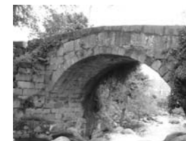
Puente romano. ( Piedralaves)

Saliendo de la Posada del Agua por la carretera N-403 llegamos a El Tiemblo, siguiendo por esa carretera llegamos a la travesía de La Atalaya donde cogemos la AV-502, giramos a la derecha hacia la CL-501 que discurre por el Valle del Tietar, en paralelo al río, bajo las laderas de la cara sur de Gredos, en el límite sur de la provincia de Avila. El Valle del Tietar un microclima especial, con una humedad relativa más alta, lo que le permite tener más cultivos y materias primas que no encontramos en el resto de la provincia, siendo muy populares sus cerezas y quesos. Su arquitectura popular también se adapta al particular clima, con las características terrazas de madera volada, que protegen del sol en verano y permiten su paso en invierno.