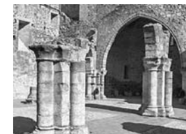
Centro de interpretación valle del Tietar ( La Adrada)